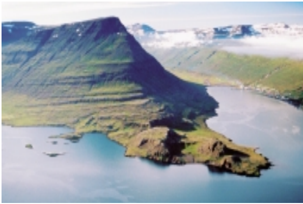
Hólmanes, Hólmatindur og hólmannir

útivistar og almenningsnota en hafa einnig að geyma fjölbreytta og fagra náttúru. Friðland er svæði sem mikilvægt er að varðveita sakir sérstaks landslags eða lífríkis. Til að ná markmiðum friðlýsingarinnar gilda eftirfarandi reglur um svæðið: