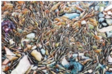
Líparitflögur í sjó við Skeleyri

Graslendi er meðfram ströndinni einkum við Baulhúsavík og kringum Leiðarhöfða en einnig við Baulhús. Mosi er áberandi í brekkum austan í Hólmahálsi, utan í Borgum og á flatlendinu upp af Skeleyri og Básam. Hann er ýmist einráður eða innan um lyng, sef eða gras. Gróskumikill lynggróður er víða í brekkum, einkum í vestanverðum Baulhúsadal, Urðarhvammi og innan um mosagróðurinn í allri brekkunni austan í Hólmahálsi.