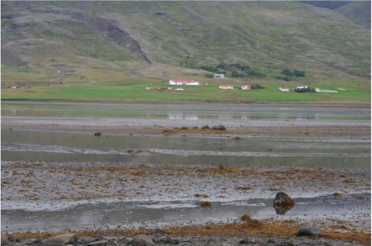
Mynd 2. Umhverfi leirunnar í Berufirði (Ljósm Erlín Emma Jóhannsdóttir 2008)