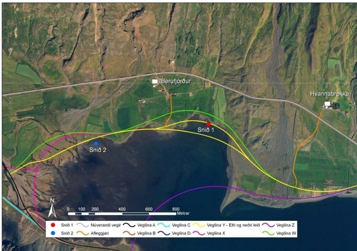
Mynd 1. Staðsetning sniða á leirum í Berufirði ásamt fyrirhuguðum veglínunum í botni Berufjarðar.