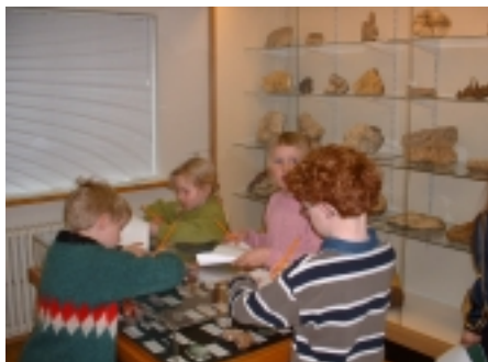
A hugasamir krakkar í náttúrugripasafninu

Náttúrustofan tók að sér rekstur Náttúrugripasafnsins í Neskaupstað vorið 2002. Safnið starfaði með nokkuð breyttu sniði þar sem bætt var við einu sýningarherbergi