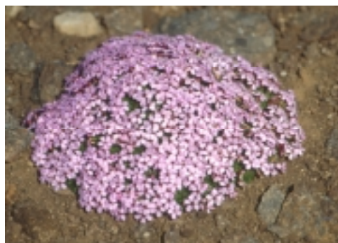
Lambagras (Silene acaulis)

Lögin gera ráð fyrir að allt að átta náttúrustofur geti starfað víðs vegar um landið. Á árinu 2002 voru Náttúrustofur sex og þá enn svigrúm til að bæta við tveimur stofum.