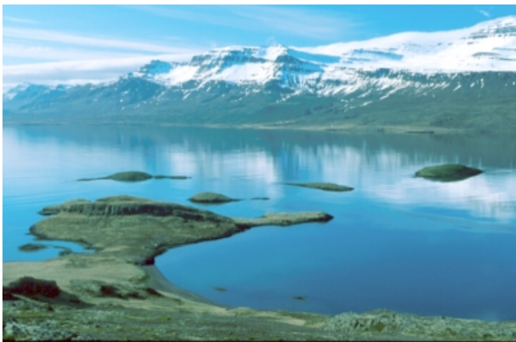
Leiðarhöfðavík, Leiðarhöfði og hólmar og sker.