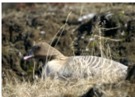
Heiðagæs liggur á hreiðri við bakka Jöklu

Skógvíst er samstarfsverkefni Náttúrufræðistofnunar Íslands og Skógræktarinnar og var þéttleiki fugla mældur í skógum á Fljótsdalshéraði. Einn starfsmaður Náttúrustofunnar tók þátt í þessari vinnu. Rammaáætlun um nýtingu vatnsafls og jarðvarma hélt áfram hjá Náttúrufræðistofnun þetta árið og vann starfsmaður frá Náttúrustofunni við það.