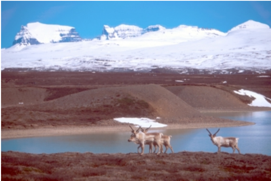
Fjórir fullorðnir tarfar á bökkum Lagarfljóts við Straum vorið 2002. Dyrfjöll í baksýn.

Á árinu var áfram unnið með norskum vísindamönnum að könnun á hugsanlegum Salmonella sýkingum í hreindýrum. Niðurstaðna er að vænta 2003.