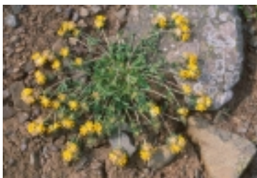
Gullkollur (Anthyllis vulneraria)

Síðan Náttúrustofan og Rannsóknastofnun fiskiðnaðarins fluttu í húsnæði Verkmenntaskóla Austurlands vorið 1999 hefur samstarf verið vaxandi milli þessara stofnanna. Vorið 2002 var undirritaður formlegur samstarfssamningur milli Náttúrustofunnar, Verkmenntaskólans og Rannsóknastofnunar fiskiðnaðarins. Þar er kveðið á um faglegt samstarf varðandi ýmis verkefni sem tengja saman rannsóknir og kennslu og einnig um afnot af húsnæði og búnaði eftir ákveðnum reglum. Stofnanirnar vænta mikils af samstarfinu.