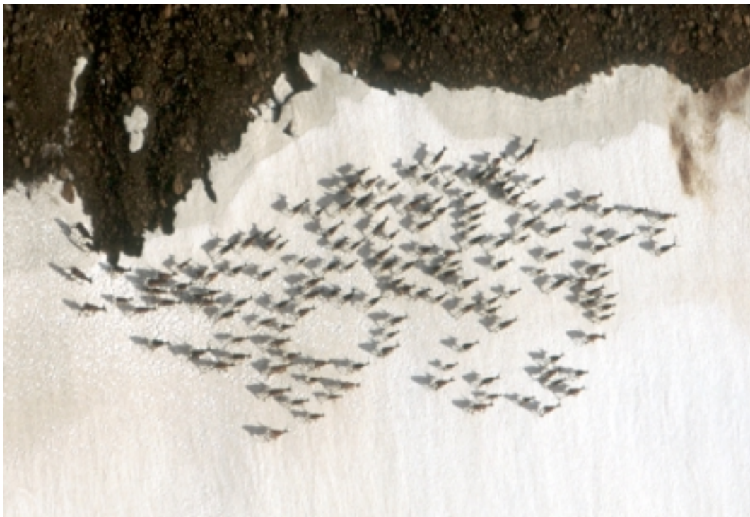
Hreindýrahópur (92 kýr, 57 kálfar og 8 tarfar) á fönn innst í Viðidal á Lónsöræfum 28. júlí 2002.

Upplýsingar um fjölda og dreifingu hreindýra á öllum árstímum er einn aðal grundvöllurinn að nýtingu stofnsins og ein aðal forsenda arðsúthlutunar. Náttúrustofan skipuleggur tvær talningar á ári, vetrartalningu í mars á öllu Austurlandi og talningu í júlíbyrjun á Snæfellsöræfum. Einnig er stöðug skráning í gangi í samvinnu við heimamenn. Efla þarf þessar rannsóknir og er vænst að mögulegt verði að hengja gps staðsetningartæki um háls dýra á svæðum þar sem upplýsingar um hagagöngu vantar. Talningar 2002 heppnuðust vel. Í vetrartalningu fundust 3051 hreindýr en í sumartalningu á Snæfellsöræfum 2297 dýr. Auk þessa var leitað að dýrum úr lofti í Austur-Skaftafellssýslu austan Hornafjarðarfliots og fundust þar 270 dýr.